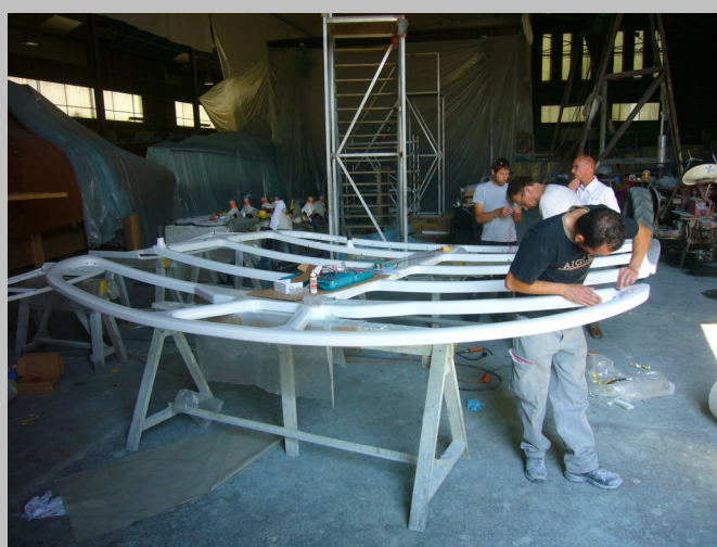
Finitions sur la structure